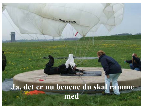
Ja, det er nu benene du skal ramme med

I juni blev han nummer 2 i Haralds minde cup i SIF ÅRH præcisionskærm, men det vides ikke om han brugte den nye stil?