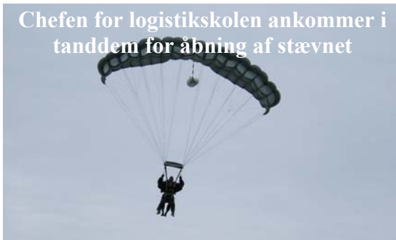
Chefen for logistiskolen ankommer i tanddem for åbning af stævnet

Vejret så ellers rimeligt ud, men vi tog vist nogle skyer med fra Århus, som drillede os lidt om eftermiddagen. Efter den officielle åbning af stævnet, gik flyene på vingerne, der var lejet 3 fly til afvikling af mesterskabet. Efter 1,5 runder præcisionsspring, åbnede det op i de øverste etager, og vi overgik straks til formations cup og det gik virkelig stærkt med 3 fly, selv om det ene klagede voldsomt på grund af et meget træt næsehjul. Flyet blev da også til sidst taget ud.