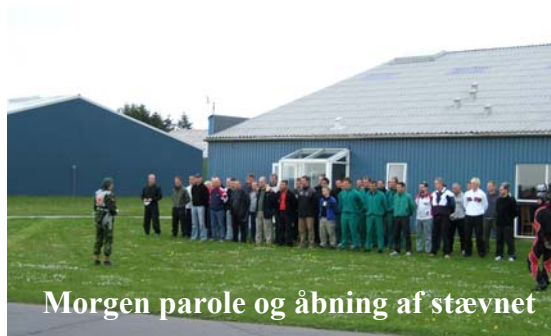
Morgen parole og åbning af stævnet