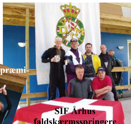
SIF Århus faldskærmsspringere

En stor tak til Hærens Logistikskoles Idrætsforening for et godt og professionelt gennemført arrangement.