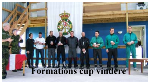
Formations cup vindere

I formation cup tog NAVY BOYS 1 sig af anden pladsen, med 17 point. JGKI-1 snupede førstepladsen med hele 29 point og på tredjepladsen MIX med 16 point. Der var 11 hold i formations cuppen.